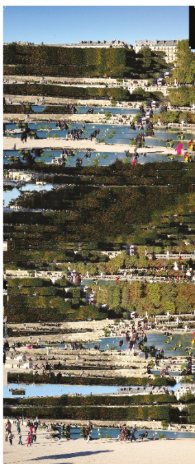
Nastassia Étudiante des Beaux-Arts de Paris