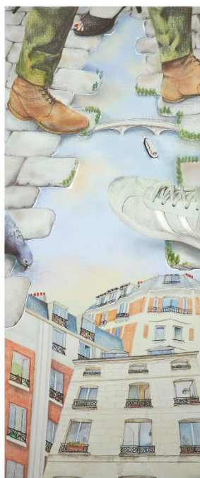
Domitille Siergé Étudiante des Beaux-Arts de Paris